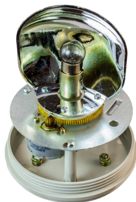
Рис. 1 – Отражатель